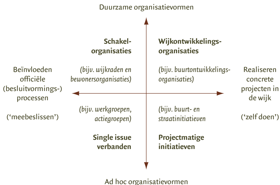
Figuur 3: Vier typen maatschappelijke verbanden van betrokken burgers in de wijk

De vier typen voortrekkers opereren niet solistisch, maar in maatschappelijke verbanden, en regelmatig ook in interactie met professionals en politici. Wanneer we focussen op de verschillende maatschappelijke verbanden of organisationele ‘habitats’ waarbinnen de vier typen voortrekkers regelmatig opereren zien we het volgende: